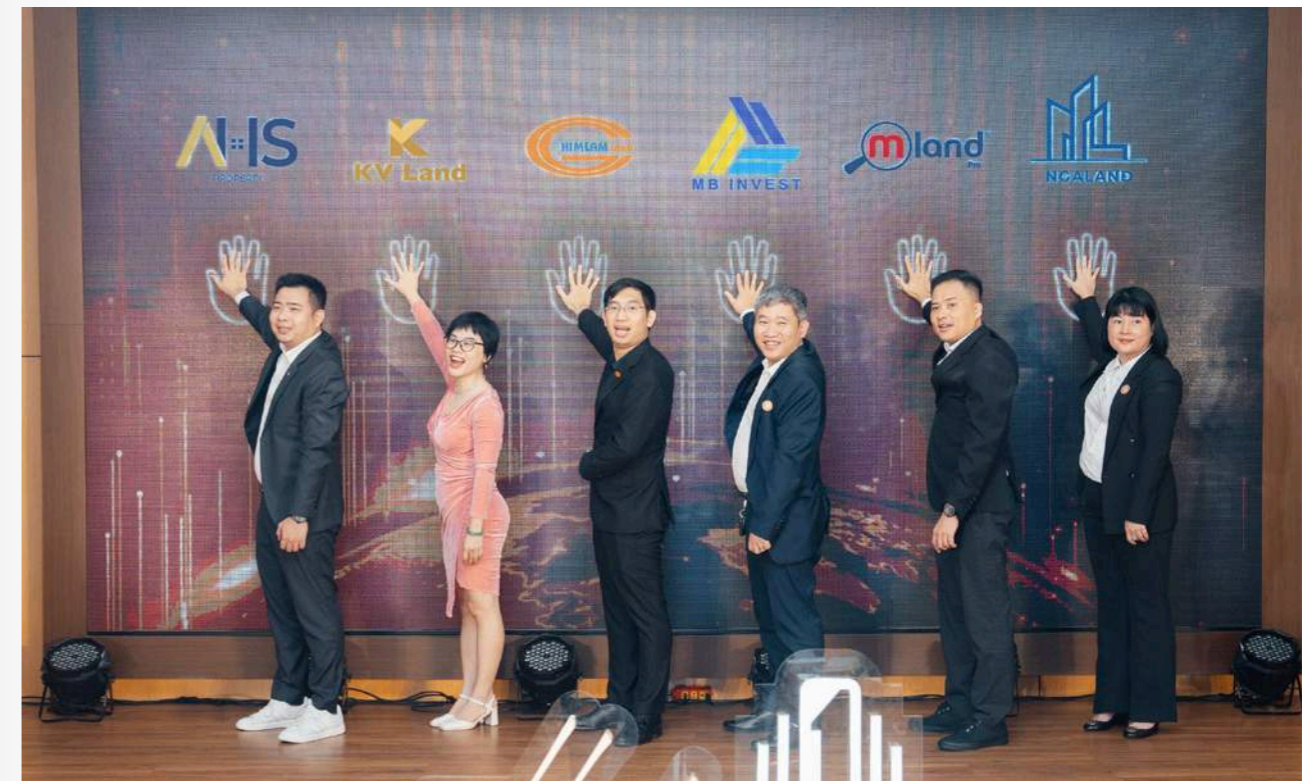
Him Lam Land cùng các hệ thống phân phối thực hiện nghi thức ra quân

Cao trào của sự kiện được đẩy lên mạnh mẽ khi đại diện Him Lam Land cùng đại diện các đơn vị Sàn phân phối cùng tham gia nghi thức ra quân, chính thức khởi động cho chiến dịch kinh doanh lần này.