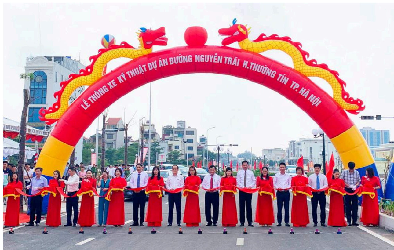
Thực hiện nghi lễ thông xe kỹ thuật đường Nguyễn Trãi (đoạn từ đường tỉnh lộ 427 đến đường ngang trạm điện 500kV) huyện Thường Tín.

Mục tiêu đầu tư là phát triển, mở rộng không gian sinh hoạt công cộng, đáp ứng nhu cầu sinh hoạt văn hóa, luyện tập thể dục, thể thao, vui chơi, giải trí của các tầng lớp nhân dân trên địa bàn huyện Thường Tín. Tổng mức đầu xây dựng 55 tỷ đồng, thời gian thực hiện thi công 330 ngày.