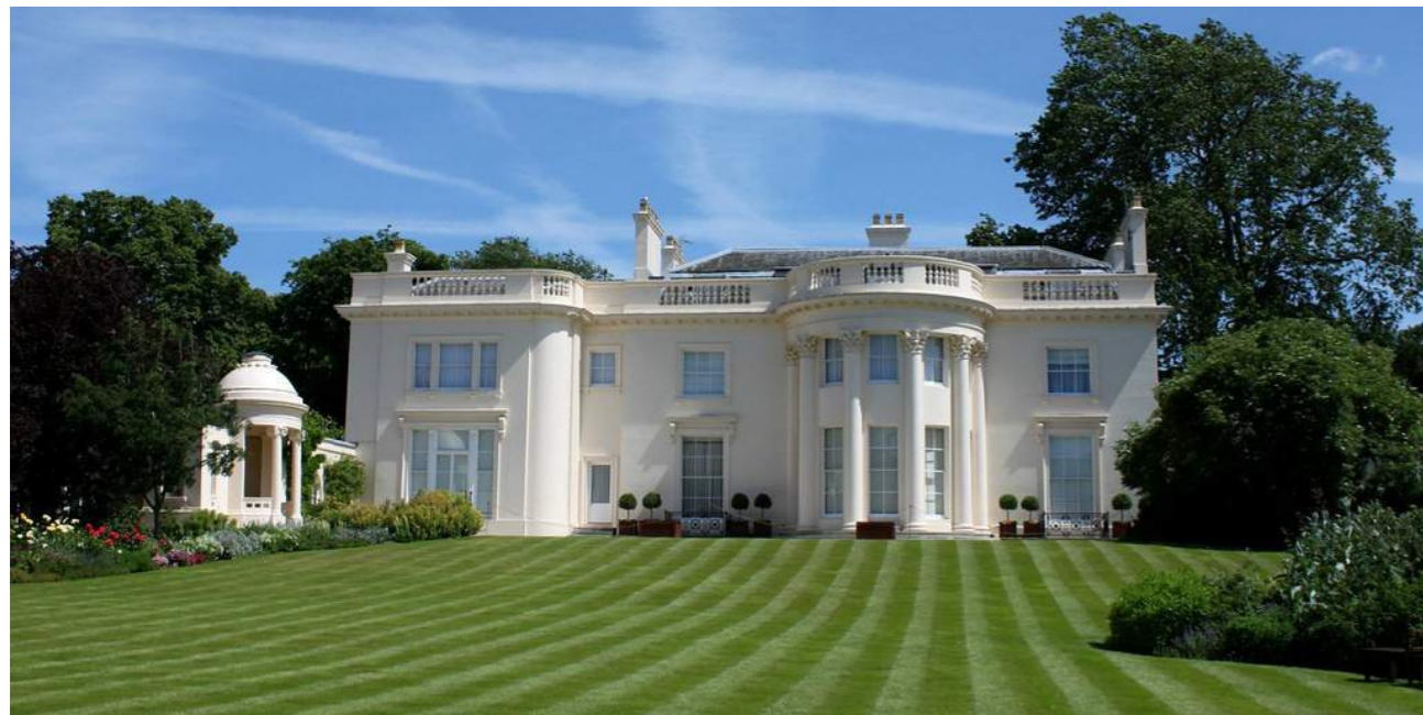
Dinh thự 205 tuổi The Holme đang được rao bán với giá 300 triệu USD.