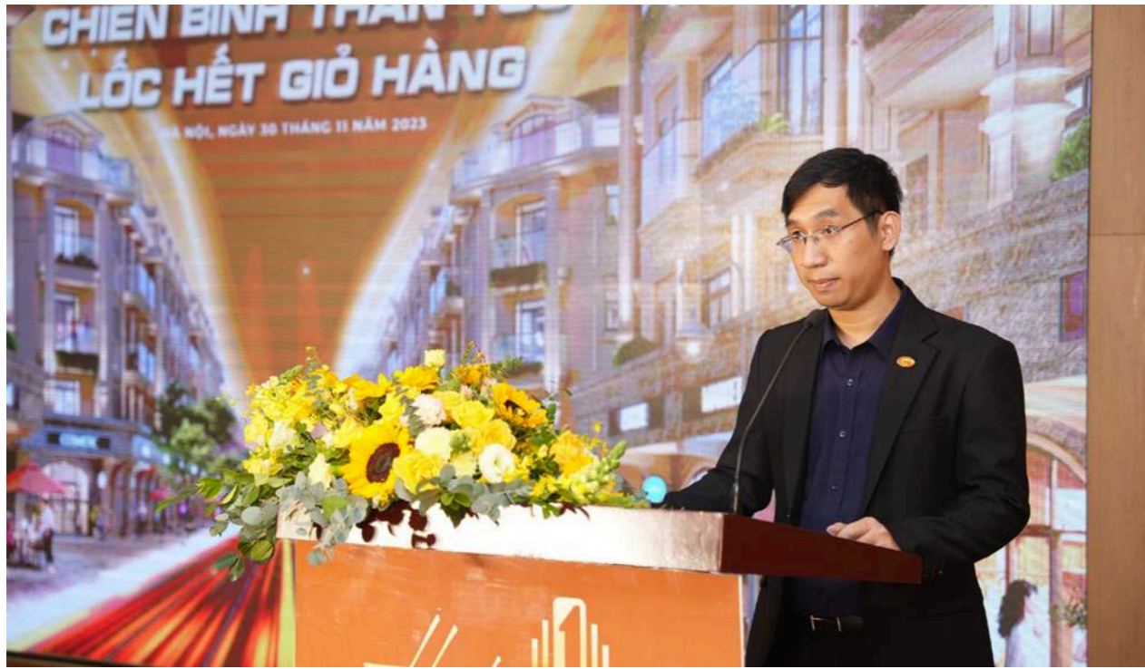
Đại diện Đơn vị Phát triển & Kinh doanh Him Lam Land phát biểu tại sự kiện

Đặc biệt, không khí càng thêm “nhiệt” khi những màn mini game bắt đầu, phần giải đáp các thắc mắc cho đội ngũ Sales đầy hứng khởi và bùng nổ cùng phần bốc thăm