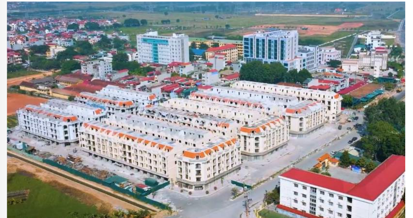
Vị trí tâm điểm của ngõ phía Nam của Him Lam Thường Tín.