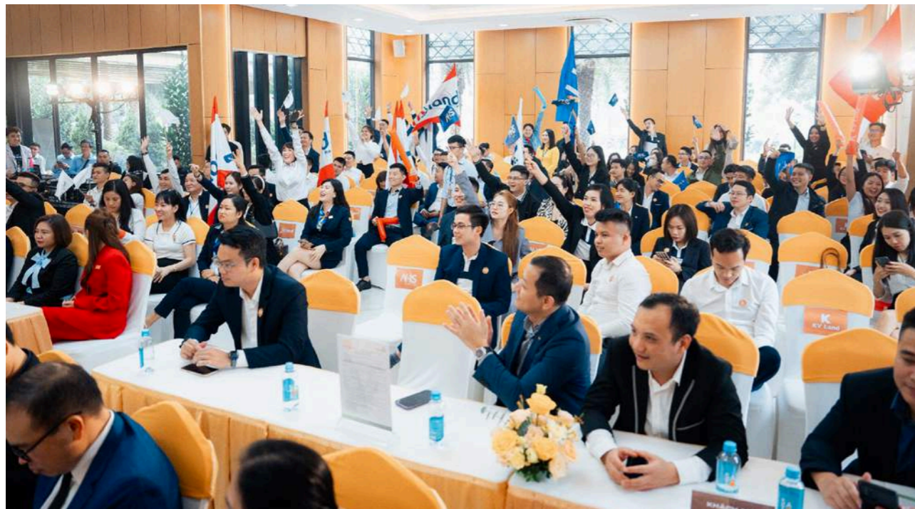
Hơn 200 chuyên viên tư vấn tham dự sự kiện kick off

chuyến hành trình chinh phục dự án Him Lam Thường Tín – Trung tâm thương mại, tài chính dành cho giới thượng lưu đầu tiên tại cửa ngõ phía Nam Thủ đô.