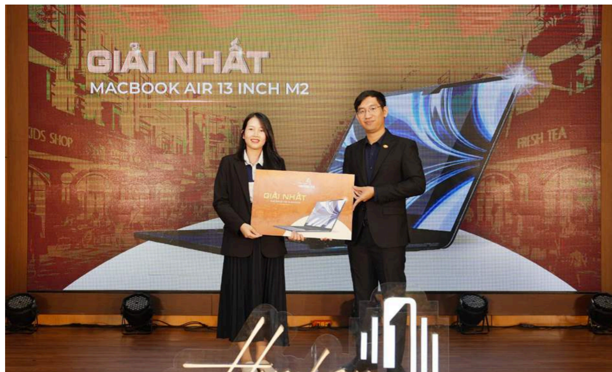
Chuyên viên kinh doanh may mắn nhận giải Nhất là 1 chiếc MacBook Air 13 inch M2

may mắn với nhiều phần quà vô cùng giá trị như: MacBook Air 13 inch M2, Máy lọc không khí Samsung; Pin sạc dự phòng Polymer 10000mAh; Loa Bluetooth Sony.